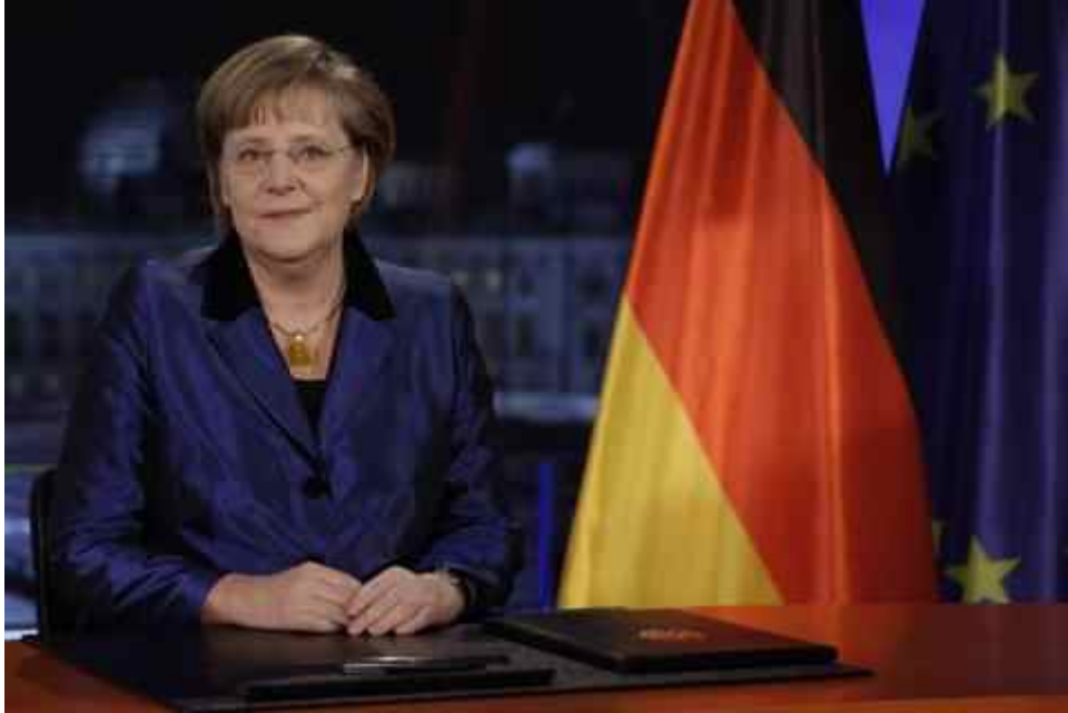
Angela Merkel Germaniae cancellaria foederalis Berolino in urbe orationem in annum ineuntem habens.

BEROLINO EX URBE. Angela Merkel Germaniae cancellaria foederalis, quae est partis christiano-democraticae (CDU), homines Germanienses adhortata est, ut anno 2011 adversus crisin euronis gravem praestarent communitatem et sumerent animum. Ab agentura dpa integra oratio reddita est: