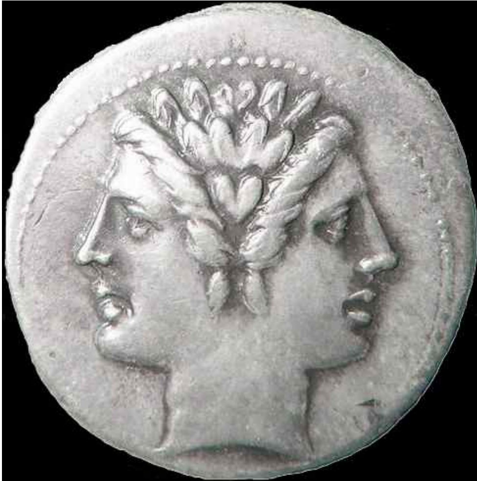
IANUS DEUS. ca.220 a.Chr.n. Museum historiae artis figurativae Vindobonense.

Iane biceps, anni tacite labentis origo, solus de superis qui tua terga vides, dexter ades ducibus, quorum secura labore otia terra ferax, otia pontus habet! dexter ades patribusque tuis populoque Quirini et resera nutu candida templa tuo! prospera lux oritur, linguis animisque favete! nunc dicenda bona sunt bona verba die. lite vacent aures, insanaque protinus absint iurgia! differ opus, livida turba, tuum.