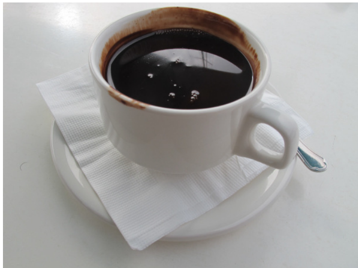
Ecce fervida cocoa Tunesiensis viscosa