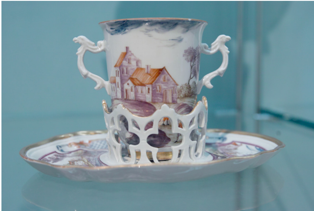
Pocillum *tremularium ( trembleuse ).

increbruit, quod inventum est eandem fieri magis aromaticam multisque Europaeis melius sapere, si dulcoraretur saccharo saccharoso. Cocoa cum esset potio Ludovico XIV. (quarto decimo) omnium gratissima, multi principes plus minusve potentes studebant imitari consuetudinem bibendi regalem. Saeculo duodevicesimo in more erat cocoam bibere pocillo tremulario ( sit venia verbo ), ut potio pretiosa biberetur sine iacturâ.