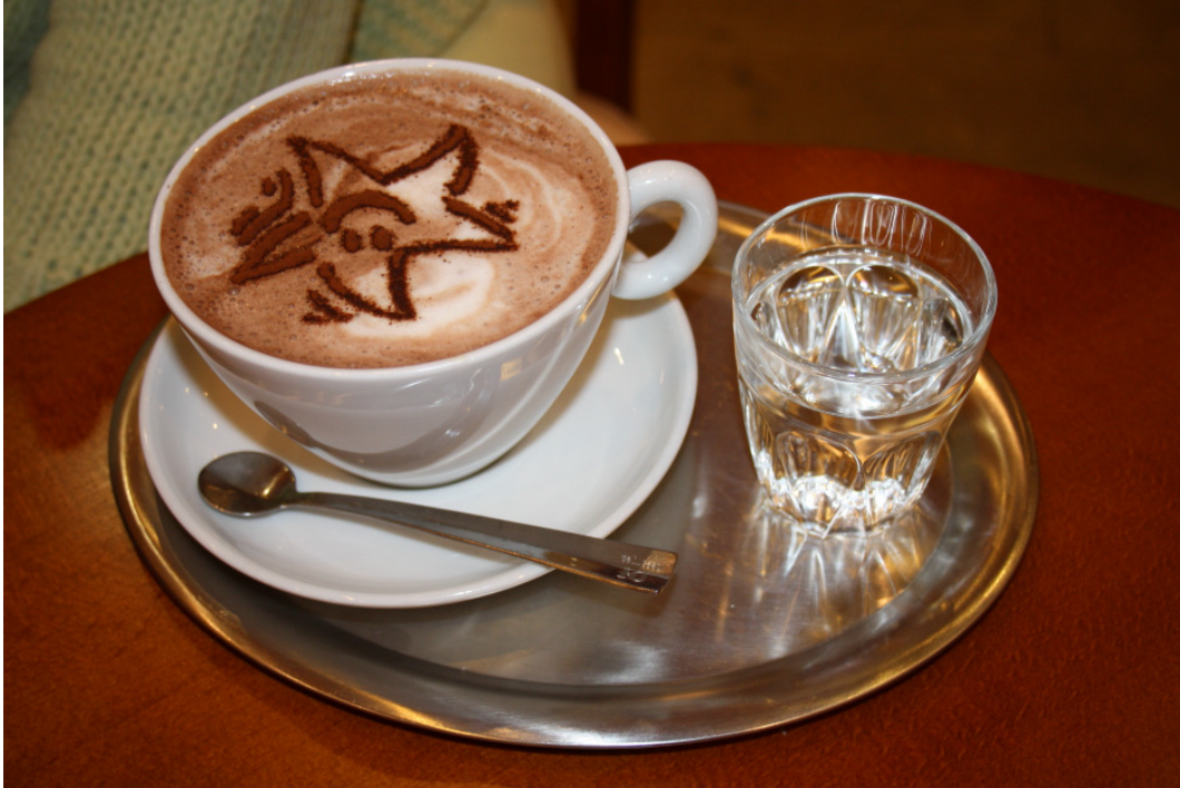
Ecce pocillum cocoaë, cui iuxtapositus est hyalus aquae.