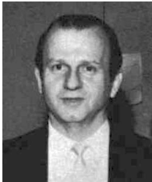
JACK RUBY (1911-1967)

Iacobus Rubenstein ( Jack Ruby ) anno 1911 natus, postquam hic illic victum quaesivit anno 1943 in exercitu stipendium meruit et rude donatus est anno 1946, ut primae classis miles, i.e. honorifice; at idem