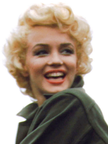
MARILYN MONROE (1926-1962)

Anno 1938, brevi ante alterum bellum mundanum exortum, Iosephus Kennedy Londinium missus est; ibi ostendit se favere socialismo nationali; qua de causa a praeside vituperatus in Civitates Unitas reversus a cursu politico appetito desistere coactus est; itaque non iam suum cursum honorum, sed filiorum tacite et in umbra fovere studuit; praeter filium Iosephum Patricium, qui in acie versatus anno 1944 in Europa mortuus erat, reliquos tres filios Iohannem et Robertum et Eduardum tam studiose fovit, ut legislatorio munere fungerentur; attamen cum potuum prohibitorum commercium olim egerat, suspicio exorta est tres filios Iosephi parlamentum posteaque munus praesidentis petentes a mafia adiutos esse; a mafiosis igitur, qui Lege Sicca facti erat potentissimi ditissimique, non solum alcohol, quod interim iam erat licitum, sed etiam drogarum mercatura agebatur; ad hoc commercium illegitimum faciendum cum mafiosi auxilio egerent magistratum, Kennedyanorum cursum politicum foverunt ea condicione, ut sibi postea gratia referretur a legislatoribus reliquisque magistratibus.