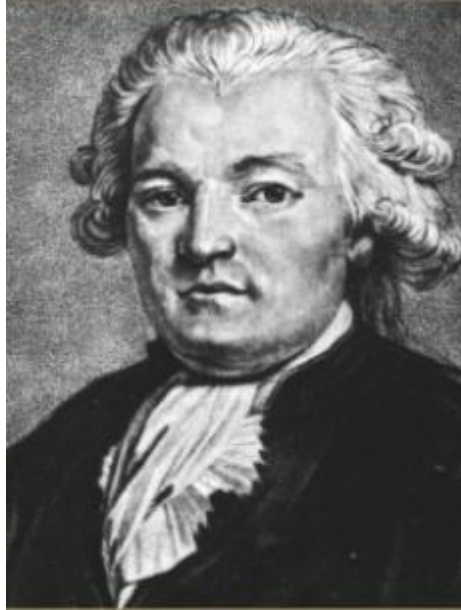
Johannes Anthelmus Brillat-Savarin (1755-1826) qui fuit gastrósophus

„Ad cocoam parandam, i.e. ad cacaonem talem faciendam, ut statim eâdem fruaris, sumito unam et semissem unciam cacaonis pro pocillo, curato, ut lentê liquescat aquâ paulatim calefactâ, spathulâ ligneâ peragitans; deinde curato, ut ferveat per quadrans horae, ut perfectê dissolvatur, et apponito calidam. (...) Plus quinquaginta annis ante abbatissa Belicensis (Belley) Monasterii Visitationis Mariae mecum colloquens: »Mi Domine« inquit, »si vis bibere cocoam bonam, sinas eam vespere proximo praeterito in hirneâ porcellaneâ praeparare ibidemque permanere. Cocoa si per noctem in vasi permanet, concentratur, ut sapiat delicatius et multo iucundius. Bonus Deus certê non irascitur de hac subtilitate lautiusculâ, nam îdem ipse est ens omnium subtilissimum«. “