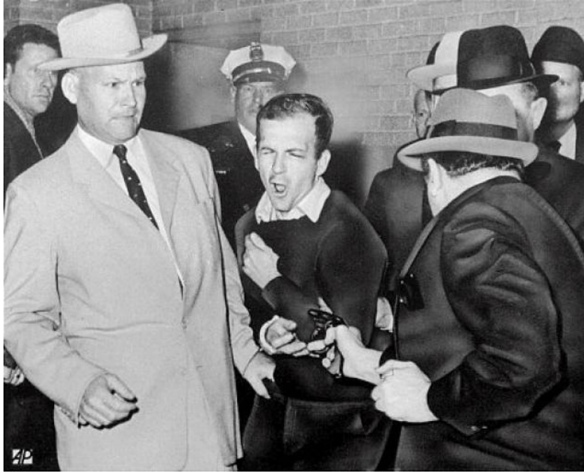
RUBY REVOLUCRO COLTIANO IACULATUR IN OSWALDUM