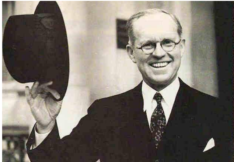
IOSEPHUS KENNEDY (1888-1969)