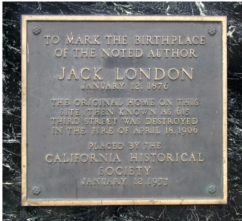
Tabula memorialis in loco domûs Londonianae natalis, Franciscopoli, in angulo Viae 3ae et Viae Brannianae posita