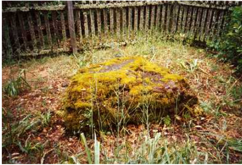
SEPULCHRUM IACOBI & CHARMIANAE LONDONII IN PRAEDIO EORUM SITUM

Iacobus Londonius mortuus est quadragenarius in praedio suo, quod situm erat Glen Ellen in vico Comitatus Sonomae . Plerique biographi Londonii priores opinati erant eundem auctorem fabularum ipsum sibi mortem conscivisse, sed hodie multi hanc opinionem addubitant. Nonnullis indiciis videtur verisimile esse Londonium mortuum esse morbo uraemiae. Nam Iacobus Londonius annis vitae ultimis laboravit renum quadam insufficientiâ necnon antea propter alias valetudinis difficultates complures iam sectiones chirurgicas subierat. Nescimus an etiam morbus Iacobi alcoholicus aut morphinum dolores mitigans, quod denique sumpsit, contulerint ad mortem eius efficiendam. Nonnulli biographi sentiunt circuitum sanguinis propter valetudinis detrimenta universa Iacobum Londonium defecisse.