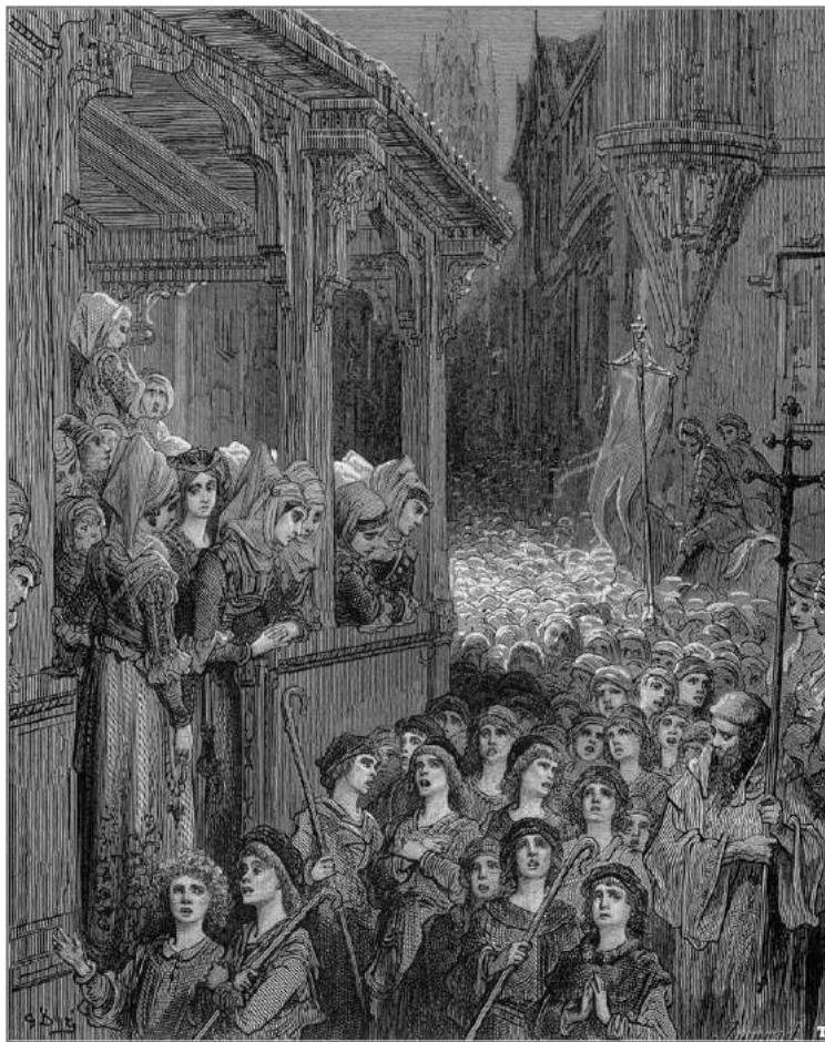
Gustave Doré (1832-1883): Peregrinatio puerorum.

Anm. 7] pudicitia, iae, f : Schamhaftigkeit, Keuschheit