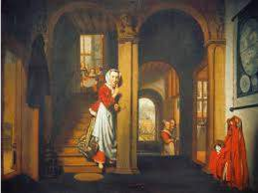
SECRETUM. A.1657 PINXIT NICOLAES MAES