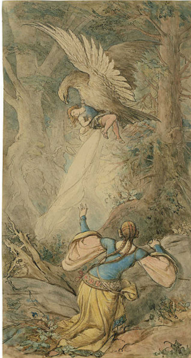
Ecce Nidarius ( Fundevoegel ). Pinxit Ferdinand Fellner (1799–1859)