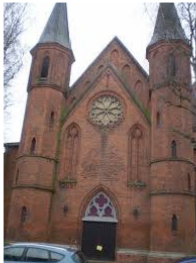
ECCE ECCLESIA SANCTI MARTINI BREMENSIS