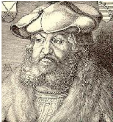
FRIDERICUS SAPIENS SAXONIAE PRINCEPS ELECTOR (1486-1525)

Vormatiam non reliquisset vivus. Fridericus curat Lutherum abducendum ad Castrum Wartburg eumque protegit manu suâ potenti, quamvis Lutherus vituperavisset Friderici falsum cultum idolorum.