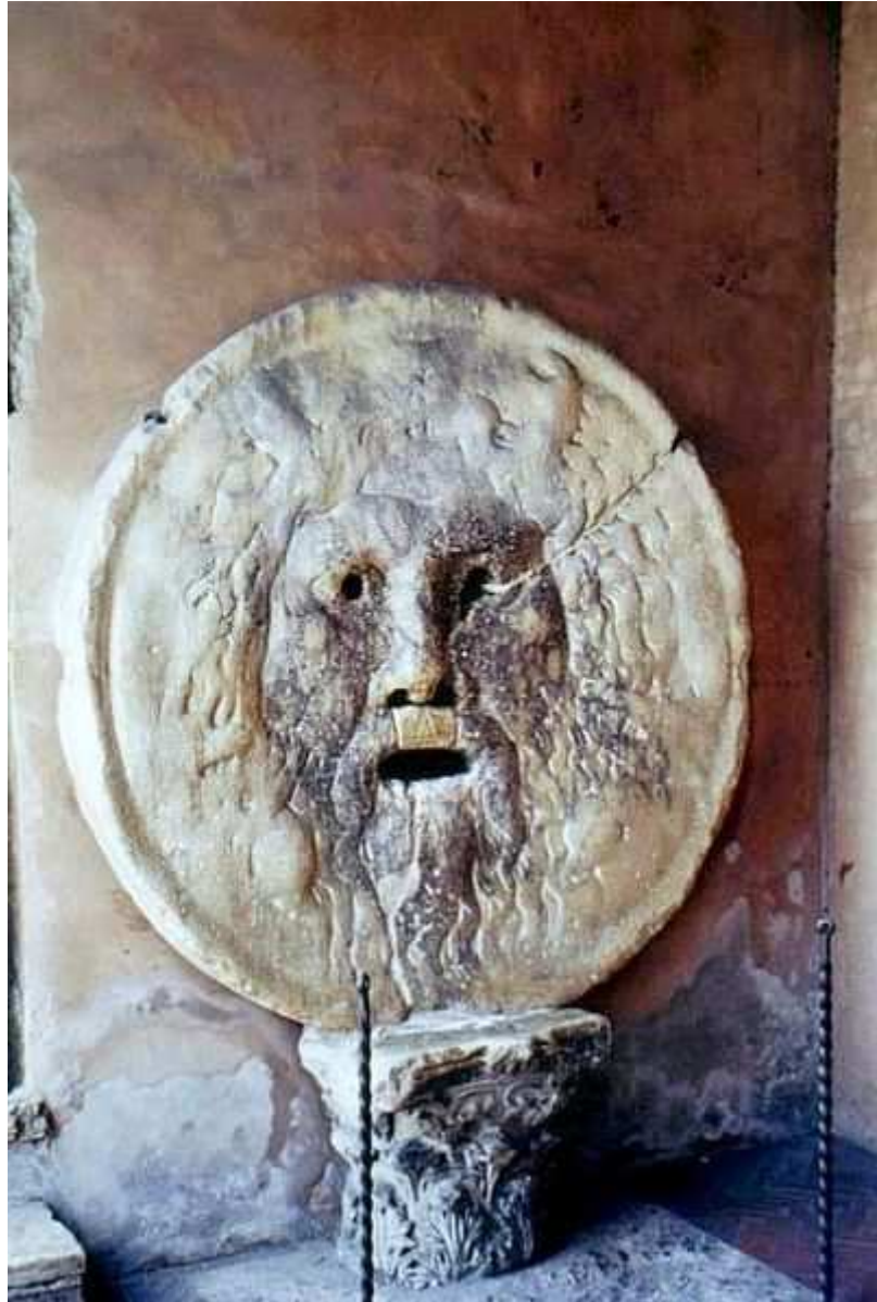
Ecce Ôs Veritatis ( La Bocca della Verità )