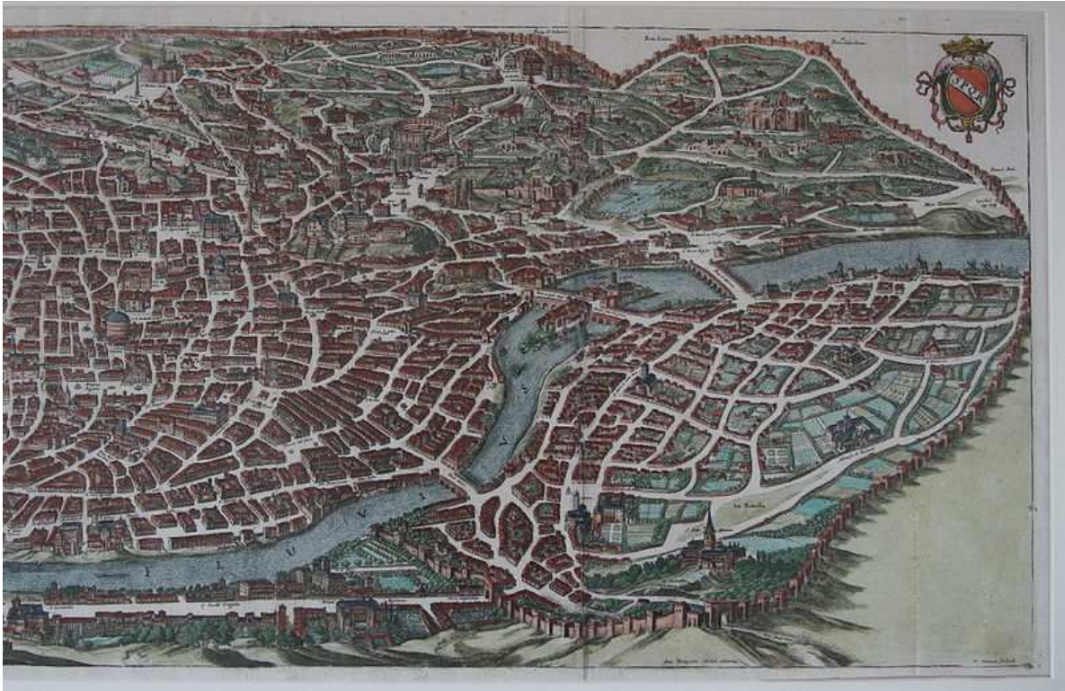
Conspectus Romae e meridie factus, circa a.1640 delineatus.