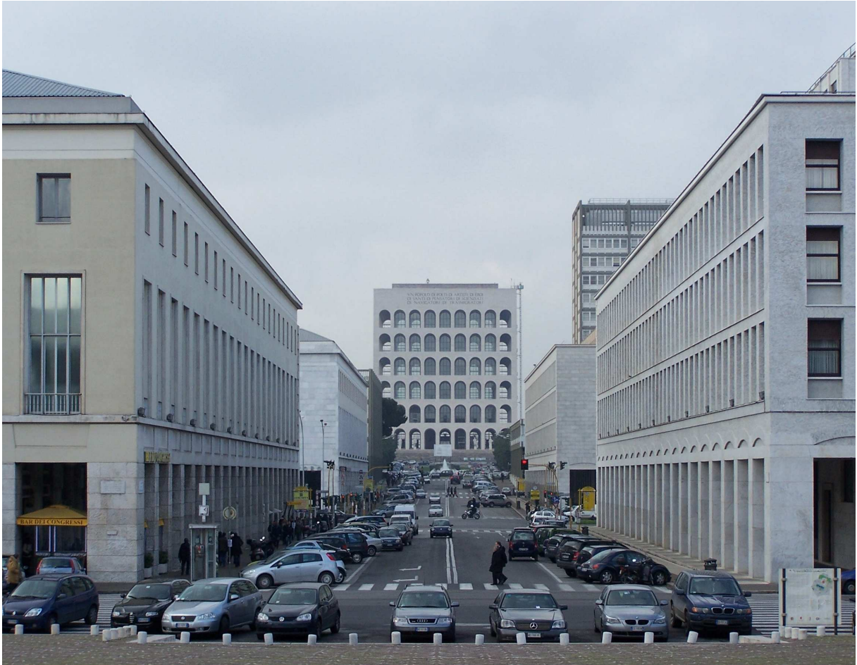
Colosseum quadratum in Tribu Expositionis Romae Universalis (E.U.R.) situm.

Urbis parte antiquâ renovandâ Romanis saepe afferuntur magnae molestiae. Itaque nonnulli cives Romani negaverant ingens stabulum autocinetorum subterraneum a.2000 in colle tofoso ad Plateam Sancti Petri sito exstruendum esse, quia timuerant, ne delerentur reliquiae archaeologicae. Eâdem de causâ nondum est exstructa linea traminis subterranei tertia, quamvis sit maximê necessaria.