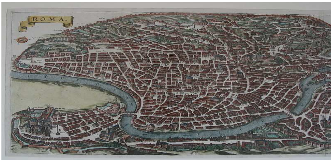
Conspectus Romae e septentrione factus, circa a.1640 delineatus.

lisdem aetatibus Urbs praecipuè insignita est ecclesiis, sed etiam novis viarum tractibus, quorum erant axes optici obeliscis impositi, palatiis, plateis, quibus inerant putei. Hic status Romae cum remaneret usque ad hodiernum diem, civitas Romae antiqua praeter Sedem Vaticanam titulo hereditii cultûs civilis mundani honorata est.