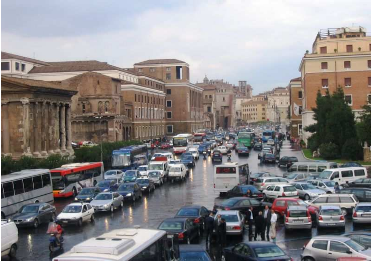
Commeatus vehiculorum Romanus adhuc est magnâ difficultate.

Incolae Urbis sat pecuniosi in aliquo e cavaediis, quae saepe plantis obsita diligenter coli solent, possident habitaculum, immo villulam in Urbe sitam. In summâ ex eo tempore, quo burgimagister electus est Rutelli(us) , qui partis politicae est Prasinorum, et Silvius Berlusconi(us) praeses Italiam gubernat, condicio Urbis parum melior facta est.