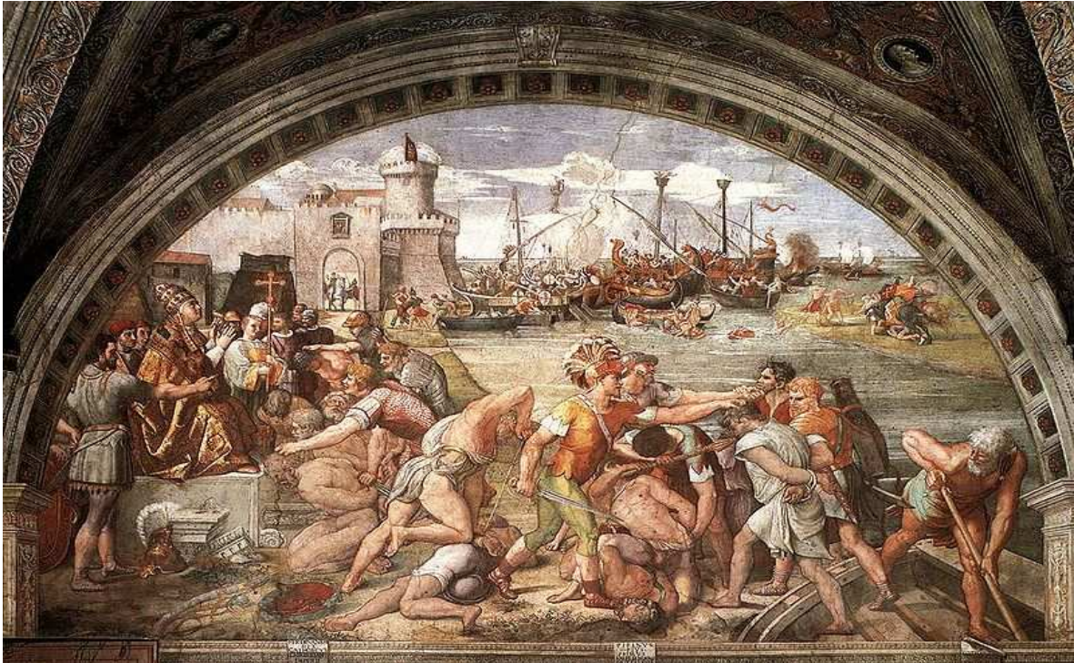
Proelio Ostiensi a.849 impeditus est arabicus impetus tertius.

De Româ quid factum sit mediâ aetate adultâ novâque aetate