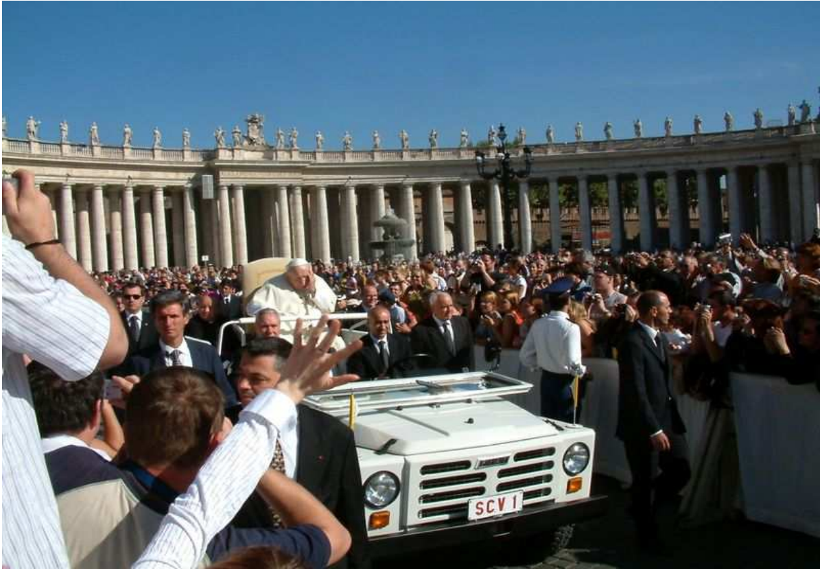
Papa Iohannes Paulus II. in plateâ ante Ecclesiam Petri cathedralem sitâ versans.

Iohanne Paulo II.o Pontifice Urbs bis tantâ affluentîâ hominum abundavit, quantâ numquam antea. Anno 2000 (bis millesimo) Die Iuventutis Universali ad missam sacram participandam duo miliones (vicies centena milia) hominum ad portas Urbis venerunt. D.8. m.Apr. a.2005 in Plateâ Sancti Petri sollemnium funeralium participes fuerunt ducenti rerum publicarum gubernationumque praepositi necnon tres quattuorve miliones hominum, qui ex omnibus terris mundi venerant; sed trecenta tantum milia eorum sedes acceperant, ceteri caerimonias spectaverunt in magnis albis magnetoscopicis exhibitas.